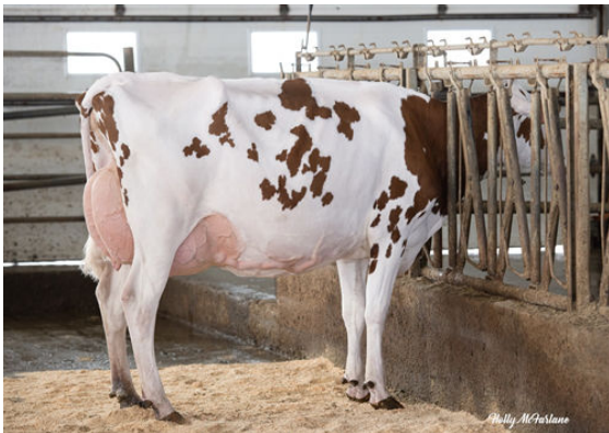
VOGUE MIRAND RED WINE-PP