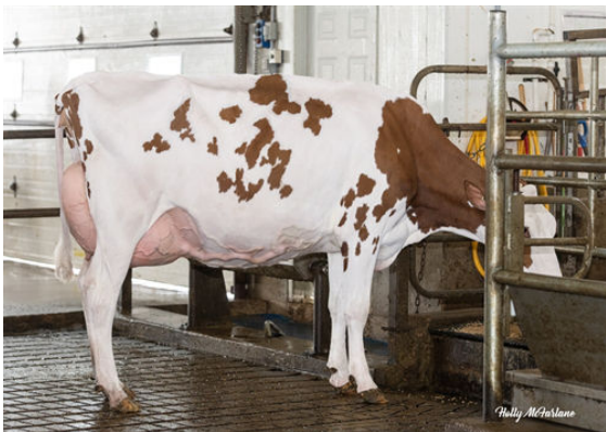
VOGUE MIRAND RED WINE-PP