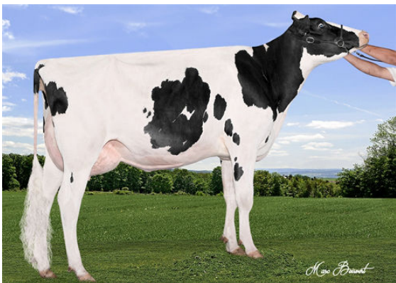
JOSEY-LLC UNO SANGARIA